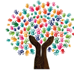
Spiel- und Lernstube „Im Kreuzchen“